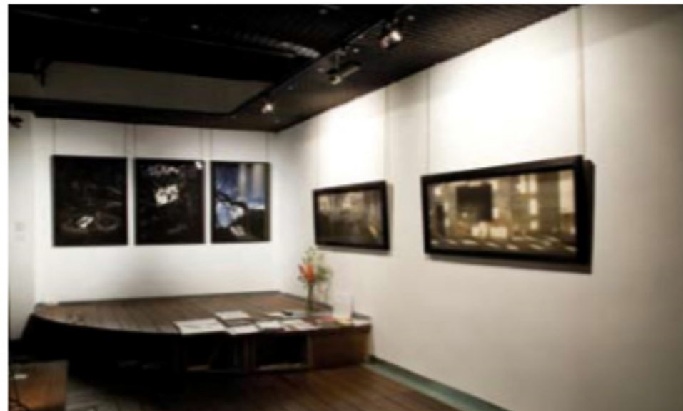
La galería Blanca Berlín, especializada en fotografía, ofrece un amplio espacio para exposiciones y otros eventos.

La fotografía va ganando adeptos en nuestro país y presencia en galerías. Distrito 4, todo un éxito de ventas en ARCO, expondrá la obra del fotógrafo venezolano Alexander Apóstol. La imagen fija también está presente en la nueva galería G+1,